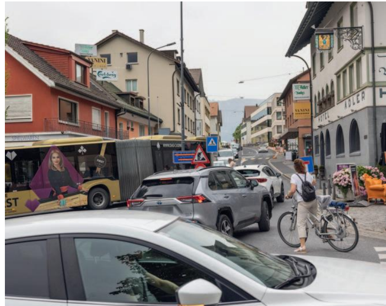
Wer besonders zu Stosszeiten in Liechtenstein unterwegs ist, hat sich längst an Stau und Wartezeiten gewöhnt. Eine Lösung für das Problem lässt im Moment noch auf sich warten, Ideen gibt es jedoch einige.

Der Arbeitsweg für Liechtensteiner ist kurz, das zeigen Auswertungen der Volkszählung. Knapp 70 Prozent der Liechtensteiner Bevölkerung hat einen Arbeitsweg von weniger als einer Viertelstunde, weniger als zehn Prozent nehmen einen Arbeitsweg von über einer halben Stunde auf sich. Der Grossteil der Einwohner