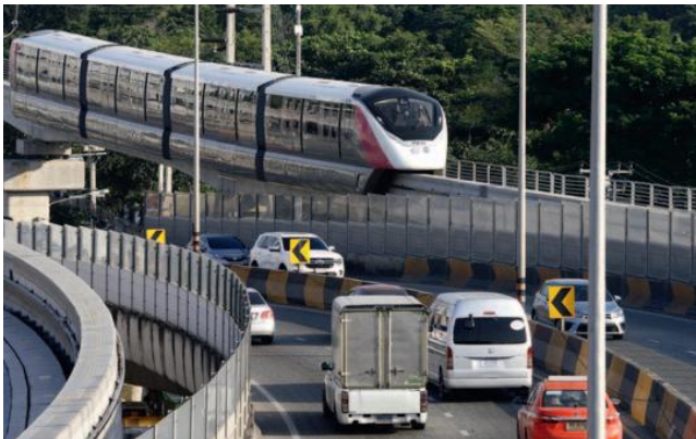
Eine liechtensteinische Lösung für den Verkehr vor der eigenen Haustüre? Die Firma Intamin aus Schaan hat die Idee einer Monorail-Bahn vorgeschlagen.